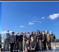
道の駅芝生広場の ステージ上で記念撮影