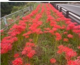
神辺堂々川の彼岸花を楽しむ