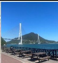
しまなみ海道 大三島多々羅大橋