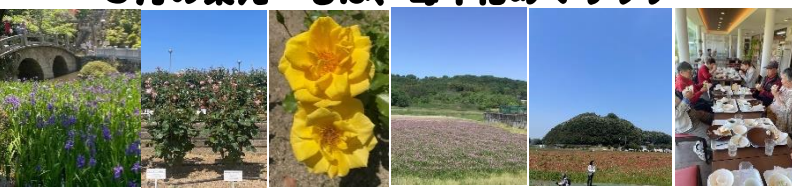
首原神社カキツバタ 福山バラ公園 見事な黄色いバラ 新山レンゲ畑 道の駅ポピー畑 そしてもっとも楽しい昼食タイム