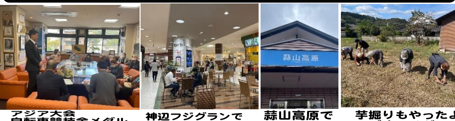
アジア大会 自転車競技金メダル 長迫吉拓選手を祝福 神辺フジグランで 楽しいショッピング 森山高原で 初秋を楽しむ 芋掘りもやったよ 腰が痛いけど