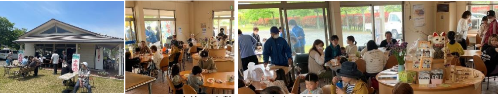
5月の連休は多勢のみなさんで賑わいました