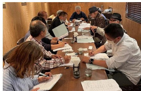
事業報告など確認す5月18日(木)の理事会