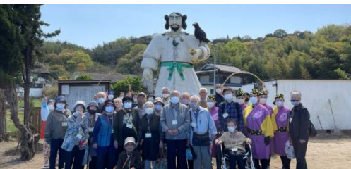
4月2日(金)は、船を貸切り、神武天皇の高島へ。地元のみなさんの大歓迎もあり、大交流、盛り上がりました。

外出困難な方、一人暮らしで話し相手を探している方 介護保険に関係なく、誰でも参加できます 毎週金曜日 一回1500円 送迎、食事付きのマイクロバスの旅です