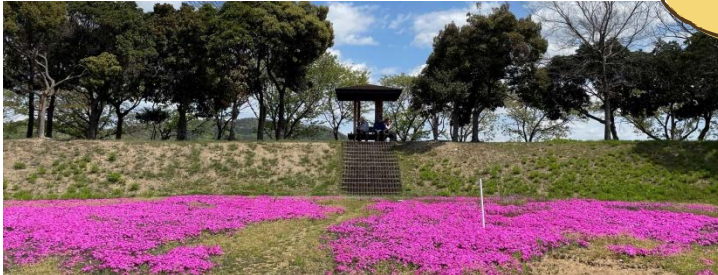
第5駐車場から近くです。(神島寄り)

平成6年に約23億円で完成した、西日本最大級の干拓堤防敷公園。花木見所いっぱいです。