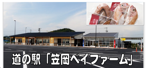
道の駅「笠岡ベイファーム」